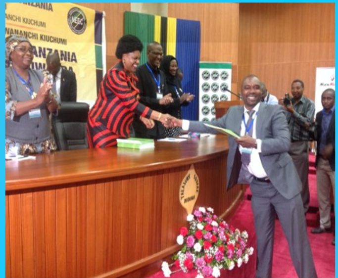
Kongamano la pili la Mwaka la Uwezeshaji Wananchi Kiuchumi, Mjini Dodoma