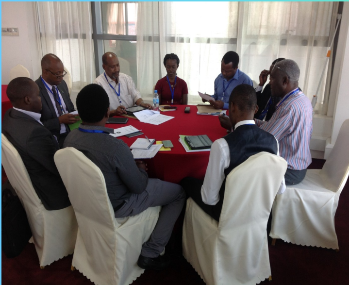
Wajumbe wakijadili mapendekezo yao ili kufanikisha mkakati wa kitaifa wa kuendeleza ujasiriamali