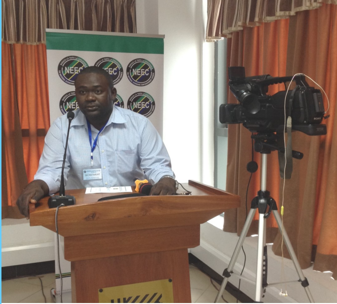
Mjumbe akizungumza jambo wakati wa majadiliano ya kuunda mkakati wa Kitaifa wa kuendeleza ujasiriamali nchini.