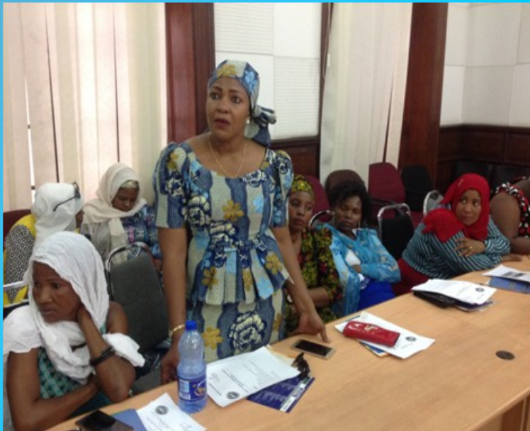
Mafunzo ya Uwezeshaji kwa vikundi vya vikoba na SACCOS