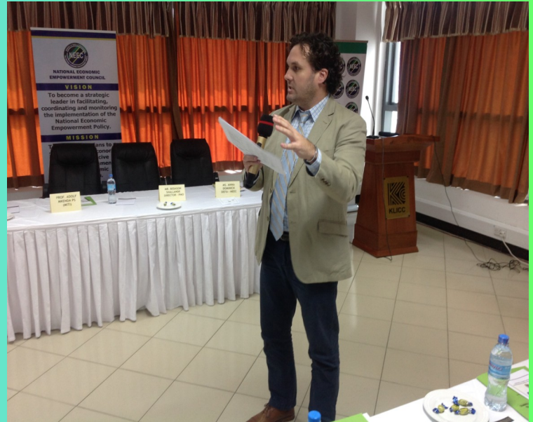
Mjumbe akichangia mada wakati wa majadiliano ya kuunda mkakati wa Kitaifa wa kuendeleza ujasiriamali nchini.