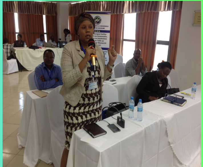
Mjumbe akichangia mada wakata wa majadiliano ya kuunda mkakati wa Kitaifa wa kuendeleza Ujasiriamali nchini.