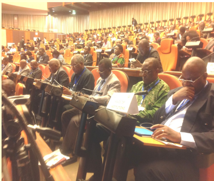
Washiriki wakifuatilia majadiliano katika kongamano la ushiriki wa Watanzania katika uwekezaji.